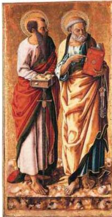
کارلو کریفلی Carolo Crivelli